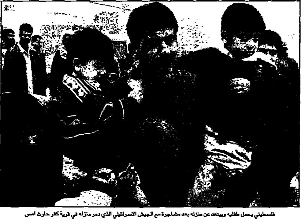
فلسطيني يحمل طفله ويبتعد عن منزله بعد مشاجرة مع الجيش الاسرائيلي الذي دمر منزله في قرية كثر حارس اس